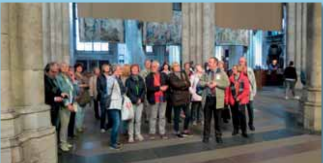
Besichtigung des Kölner Doms