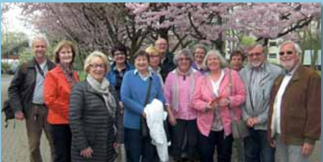
Kirschblüte am japanischen Kulturzentrum im EKO-Haus in Düsseldorf