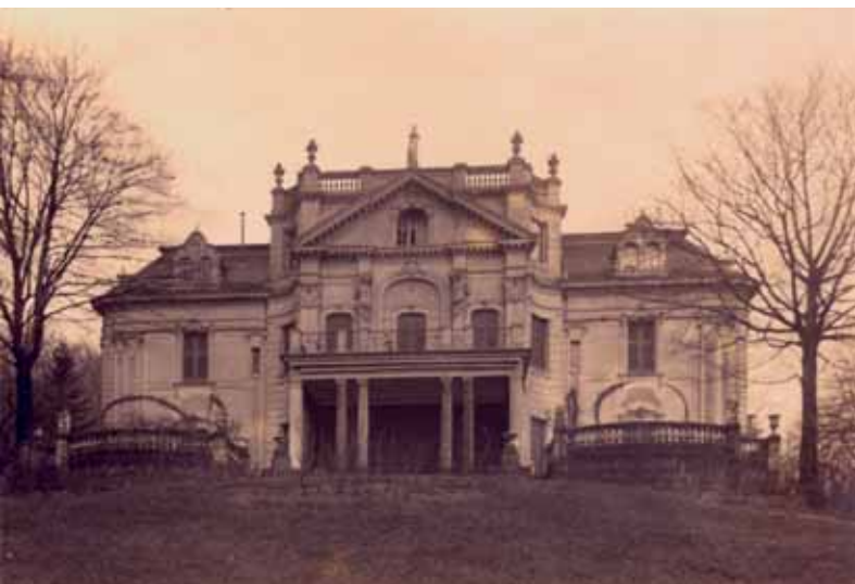
Villa Seydt, 1930, Parkseite

Kosten: Spende für den Bürgerverein Uellendahl e.V.