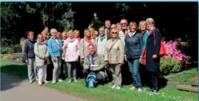
Führung über den Melatenfriedhof in Köln