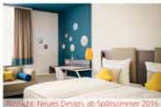
Neues Design, ab Spätsommer 2016