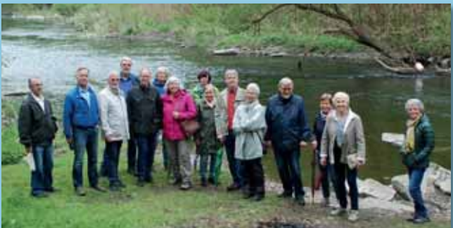
Die Wupper und ihre Entdecker...