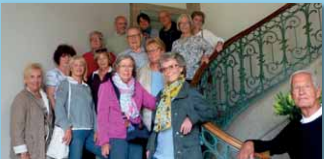
Das Schloss Benrath und seine Besucher