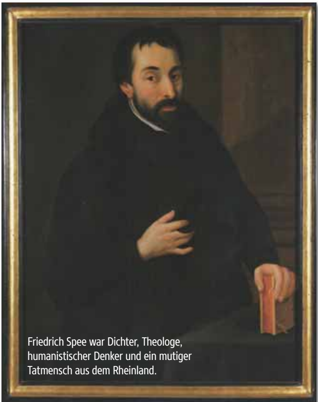
Friedrich Spee war Dichter, Theologe, humanistischer Denker und ein mutiger Tatmensch aus dem Rheinland.

Er wurde am 25. Februar 1591 in Düsseldorf-Kaiserswerth geboren, trat dem Jesuitenorden bei, wurde Domprediger und Professor für Moralthologie in Paderborn, lebte und wirkte in Köln und Trier.