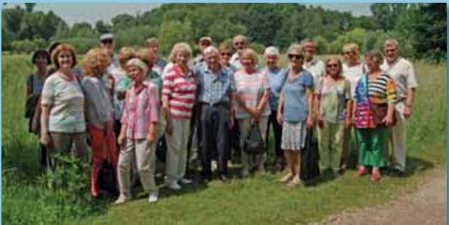
Kaiserwetter im Museum Insel Hombroich