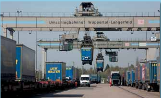
Beeindruckende Kulisse im Containerbahnhof Langerfeld